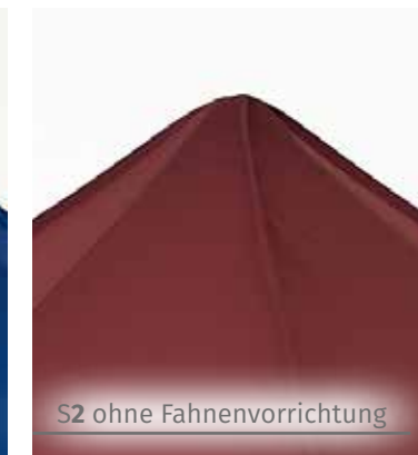
S2 ohne Fahnenvorrichtung