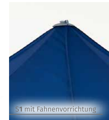
S1 mit Fahnenvorrichtung